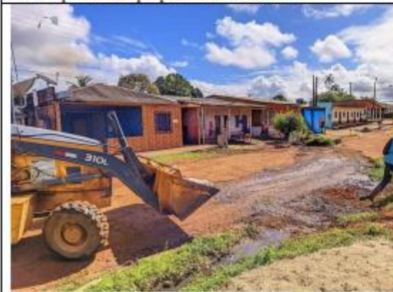
FOTO 049 – Retirada de Entulhos Bairro Nova Esperança município de Oiapoque