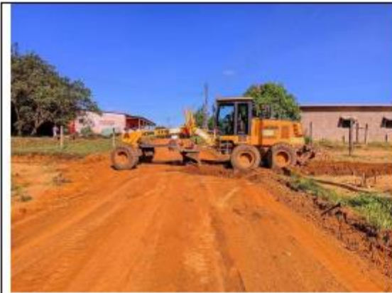
FOTO 045 - Manutenção das ruas e avenidas município de Oiapoque – Infraero