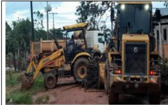
FOTO 030 – Retirada de Entulho