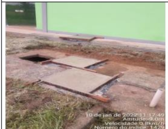
FOTO 035 - Tampa de caixa confeccionada para o terminal Rodoviário