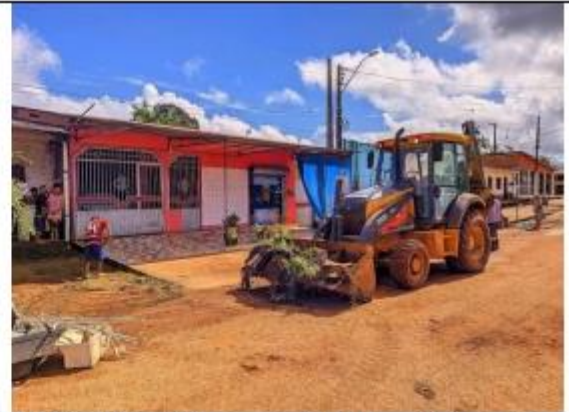
FOTO 052- Retirada de Entulhos Bairro Nova Esperança município de Oiapoque