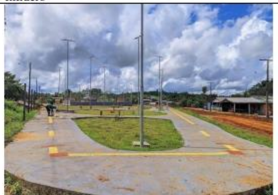
FOTO 074- Organização para inauguração