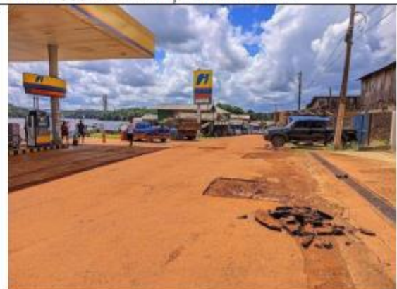
FOTO 062- Qualificação de vias