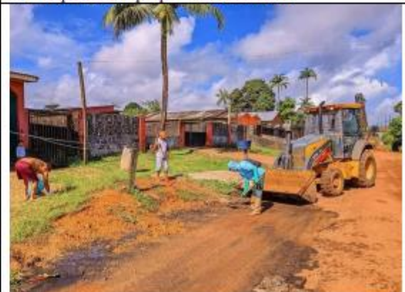
FOTO 050 – Ação contou com o apoio do Departamento da Limpeza Pública