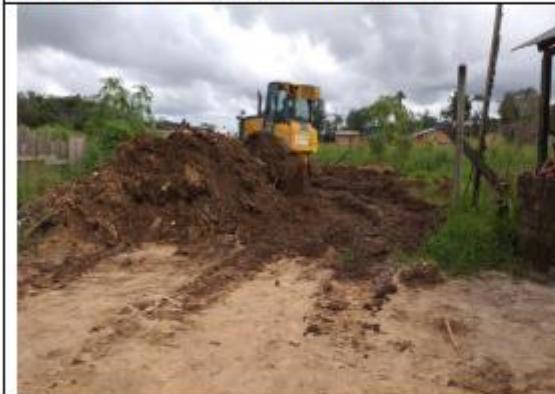
FOTO 024 - Retirada de entulho de terra