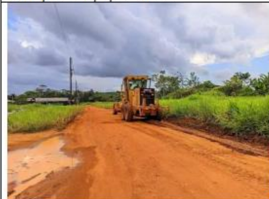
FOTO 047 - Manutenção das ruas e avenidas município de Oiapoque – Universidade