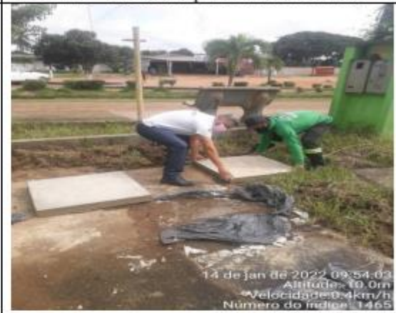
FOTO 034 – Tampa de caixa confeccionada para o terminal Rodoviário