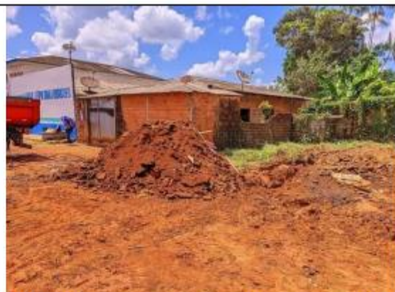
FOTO 070 - Serviços de requalificação nas ruas e avenidas