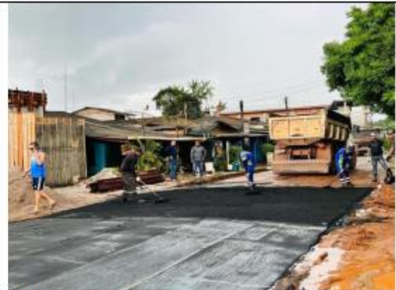
FOTO 058- A usina segue na produção da asfaáltica (Parceira entre PMO e Governo do Estado através da SETRAP).