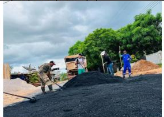
FOTO 054 – Realização dos Serviços para solucionar os problemas de trafegabilidade