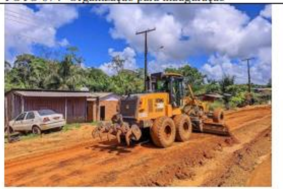
FOTO 076 - Manutenção na rua de acesso para Praça