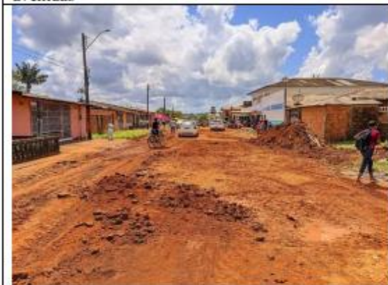
FOTO 071- Serviços de requalificação nas ruas e avenidas