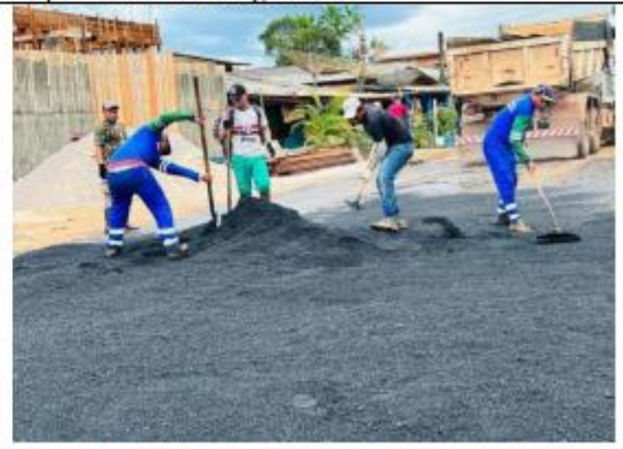
FOTO 056 – Qualificação de Vias