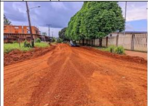
FOTO 048 - Manutenção das ruas e avenidas município de Oiapoque – Universidade