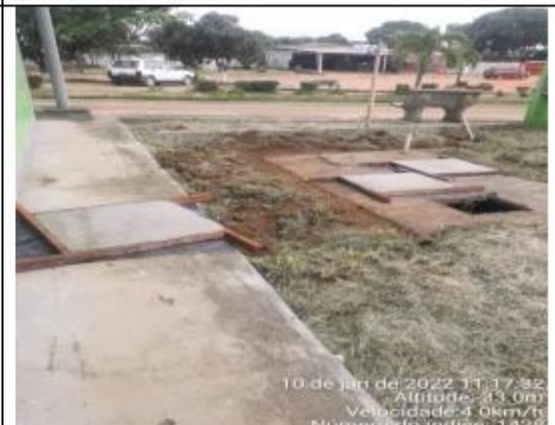
FOTO 036 - Tampa de caixa confeccionada para o terminal Rodoviário