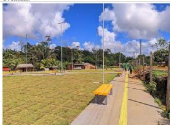
FOTO 072- Preparativos para Inauguração praça Infraero