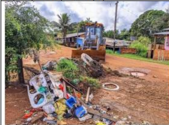
FOTO 053- Retirada de Entulhos Bairro Nova Esperança município de Oiapoque