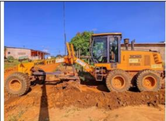
FOTO 046 - Manutenção das ruas e avenidas município de Oiapoque – Infraero