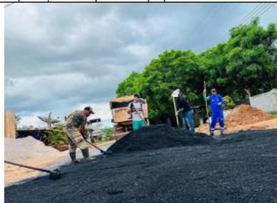
FOTO 054 – Realização dos Serviços para solucionar os problemas de trafegabilidade