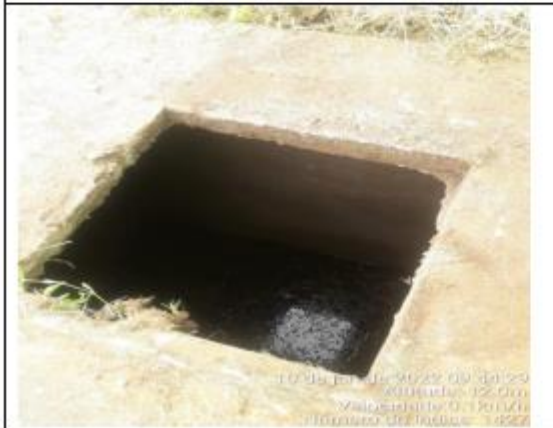
FOTO 035 - Tampa de caixa confeccionada para o terminal Rodoviário