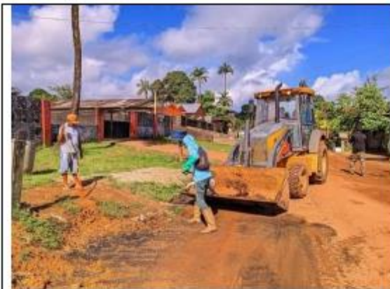
FOTO 051 - Retirada de Entulhos Bairro Nova Esperança município de Oiapoque