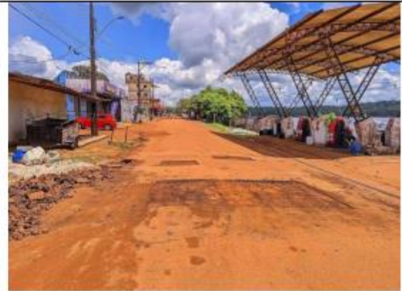
FOTO 064 - Foram iniciados os trabalhos de qualificação de vias pela Orla de Oiapoque no perímetro das proximidades da Agência da Marinha na Rua Joaquim Caetano da Silva