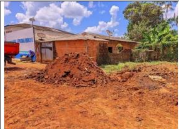
FOTO 070 - Serviços de requalificação nas ruas e avenidas