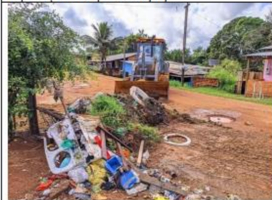
FOTO 053- Retirada de Entulhos Bairro Nova Esperança município de Oiapoque