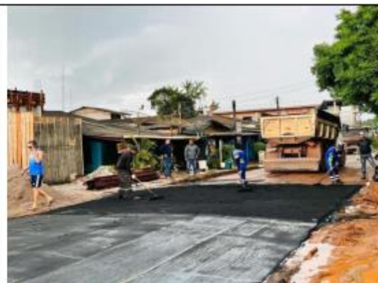
FOTO 058- A usina segue na produção da asfaáltica (Parceira entre PMO e Governo do Estado através da SETRAP).