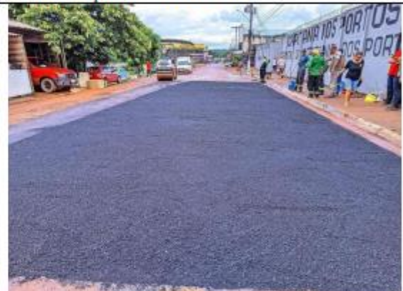
FOTO 066 - Recuperação das vias e serviço de recapeamento.