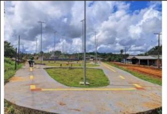
FOTO 074- Organização para inauguração