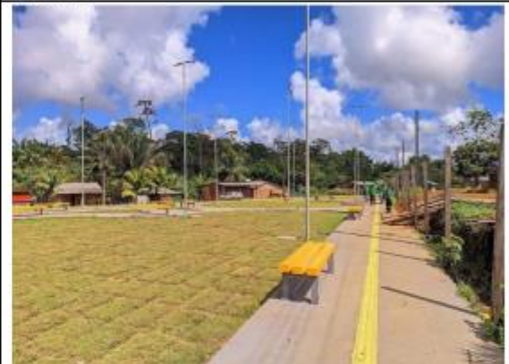
FOTO 072- Preparativos para Inauguração praça Infraero