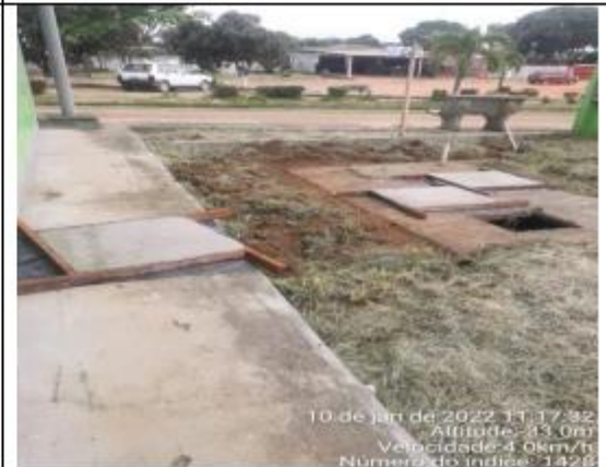
FOTO 036 - Tampa de caixa confeccionada para o terminal Rodoviário

Assinado por 1 pessoa: IVANILDE SILVA DE SOUZA CARDOSO Para verificar a validade das assinaturas, acesse https://oiapoque.1doc.com.br/verificacao/8125-E23A-E026-E8E2 e informe o código 8125-E23A-E026-E8E2