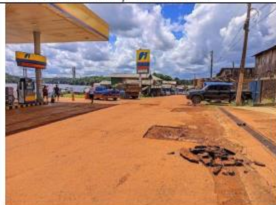
FOTO 062- Qualificação de vias