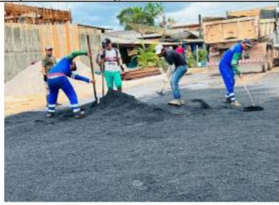
FOTO 056 – Qualificação de Vias