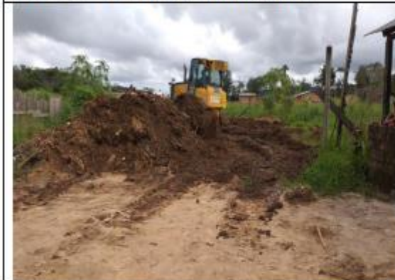
FOTO 024 - Retirada de entulho de terra