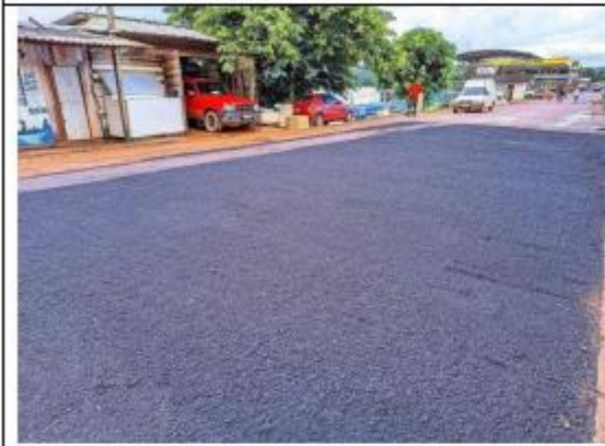
FOTO 065 - Serviços executados pela empresa CNN