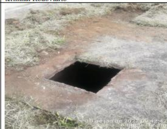
FOTO 036 - Tampa de caixa confeccionada para o terminal Rodoviário