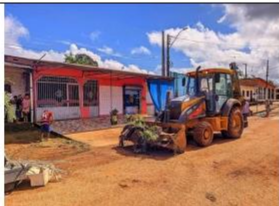
FOTO 052- Retirada de Entulhos Bairro Nova Esperança município de Oiapoque