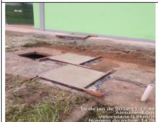
FOTO 035 - Tampa de caixa confeccionada para o terminal Rodoviário