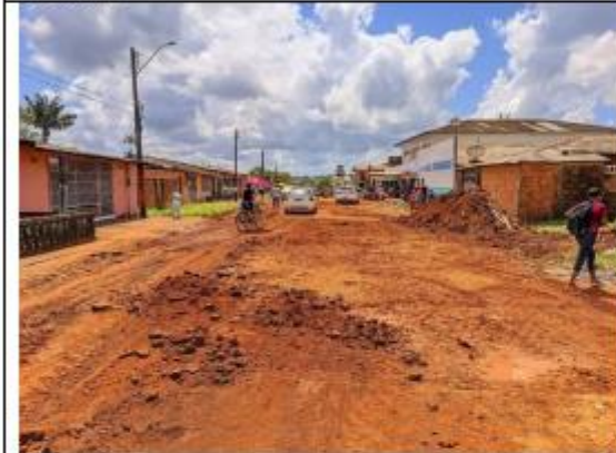
FOTO 071- Serviços de requalificação nas ruas e avenidas