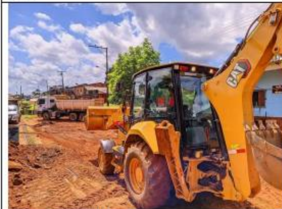
FOTO 067 – Realização dos serviços para melhorias das ruas