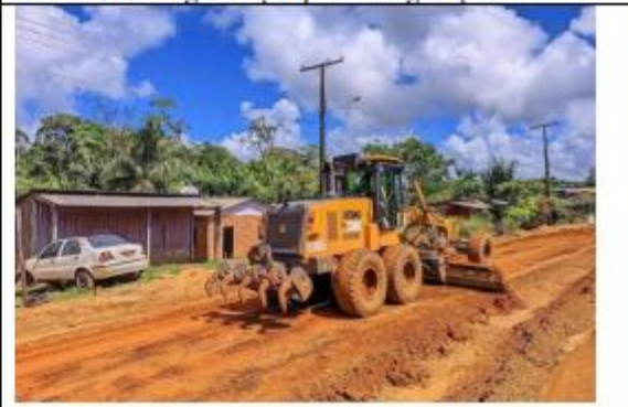
FOTO 076 - Manutenção na rua de acesso para Praça